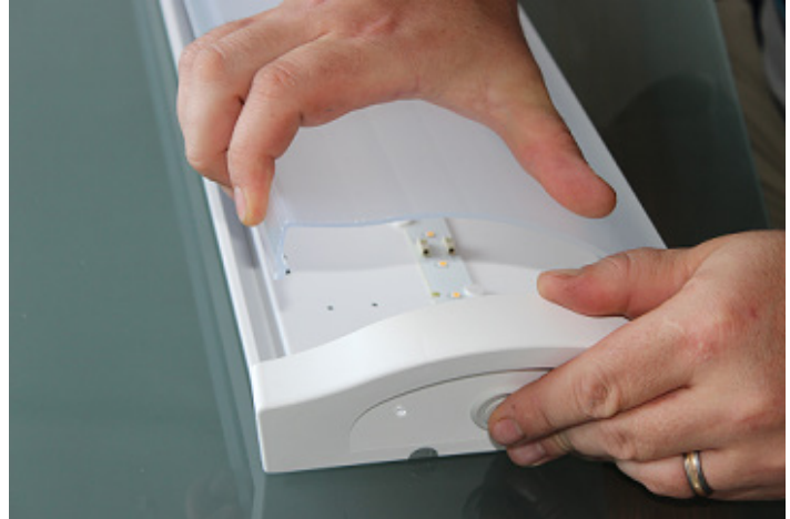
2. Taivuta päätyä etupleksin puolelta varovasti ulospäin kunnes pleksin reuna tulee näkyviin. Purista pleksiä sivusuunnassa hieman kasaan, jotta saat toisen reunan vapautumaan runkopellin reunan takaa. Vedä etupleksi pois vastakkaisen päädyn reunan alta ja poista se kokonaan.