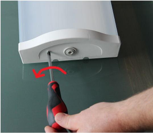
1. Irrota toisen päädyn lukitusruuvi